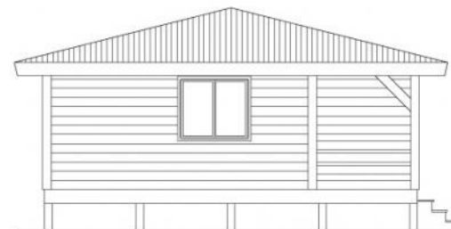
Alçado lateral esquerdo