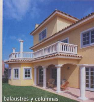
balaustres y columnas