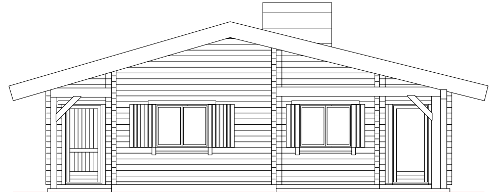
Alçado lateral esquerdo