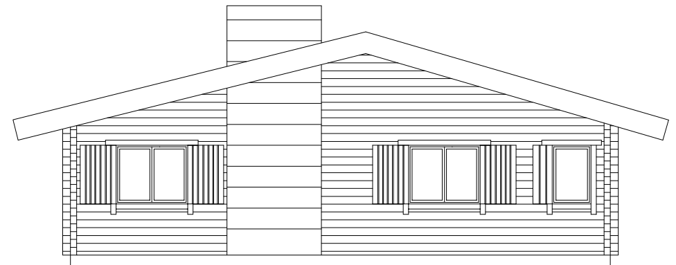
Alçado lateral direito