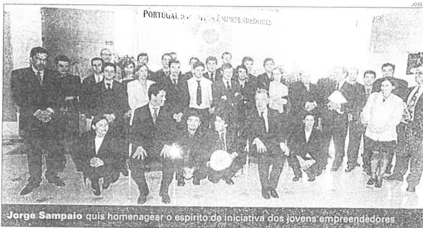
Jorge Sampaio quis homenagear o espírito de iniciativa dos jovens empreendedores

Na sequência do que viu, o presidente da República comentou: "Não acredito no futuro sem uma educação muito forte, sem uma formação profissional muito exigente e sem um espírito de iniciativa".