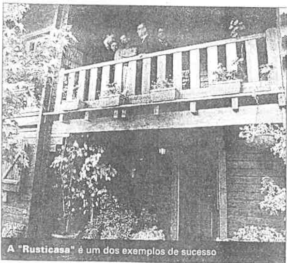
A "Rusticase" é um dos exemplos de sucesso

Mas, a principal preocupação é, segundo o jovem empresário, que a Rota "tenha um efeito pedagógico" e que contagie outras pessoas, no sentido de lhes dar que existe uma alternativa de vida, possivelmente mais estimulante, e de que o país carece